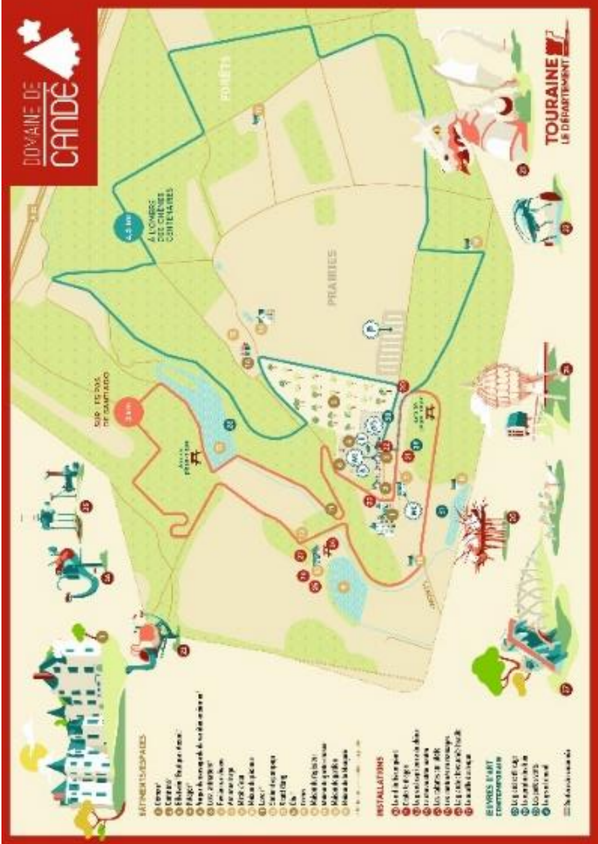
© Illustration p11 Claude ALMA - © MOKA : plan